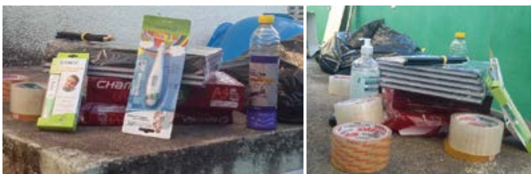
Alguns dos objetos recuperados

Tanto os vigias, quanto os GCMs, sofrem com a falta de recursos para trabalhar e são expostos a todo tipo de riscos, sem receber adicional de periculosidade, sem um ambiente seguro de trabalho, com iluminação, equipamento de comunicação, entre outros. Uma situação que ilustra as dificuldades enfrentadas pelos trabalhadores ocorreu em setembro na Unidade de Saúde da Topolândia. Mais de uma vez a “chefia” foi informada de tentativas de furto, como quando o ser-